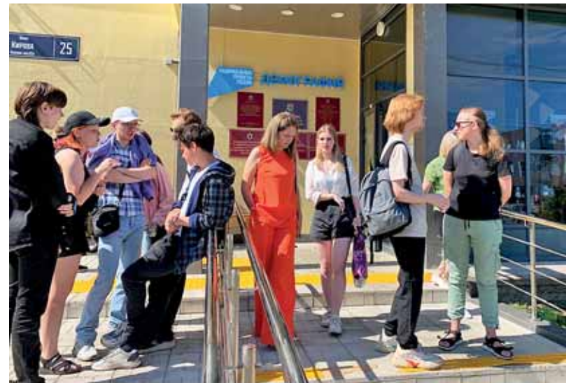
Petroskoilaiset nuoret kävivät aktiivisesti Venäjän rekrytointimessuilla, joilla tarjottiin 650 vakanssia.

– Postinjakajan pitää osata keskustella ihmisten kanssa. Tämä työ sopii seuraimisille. KS