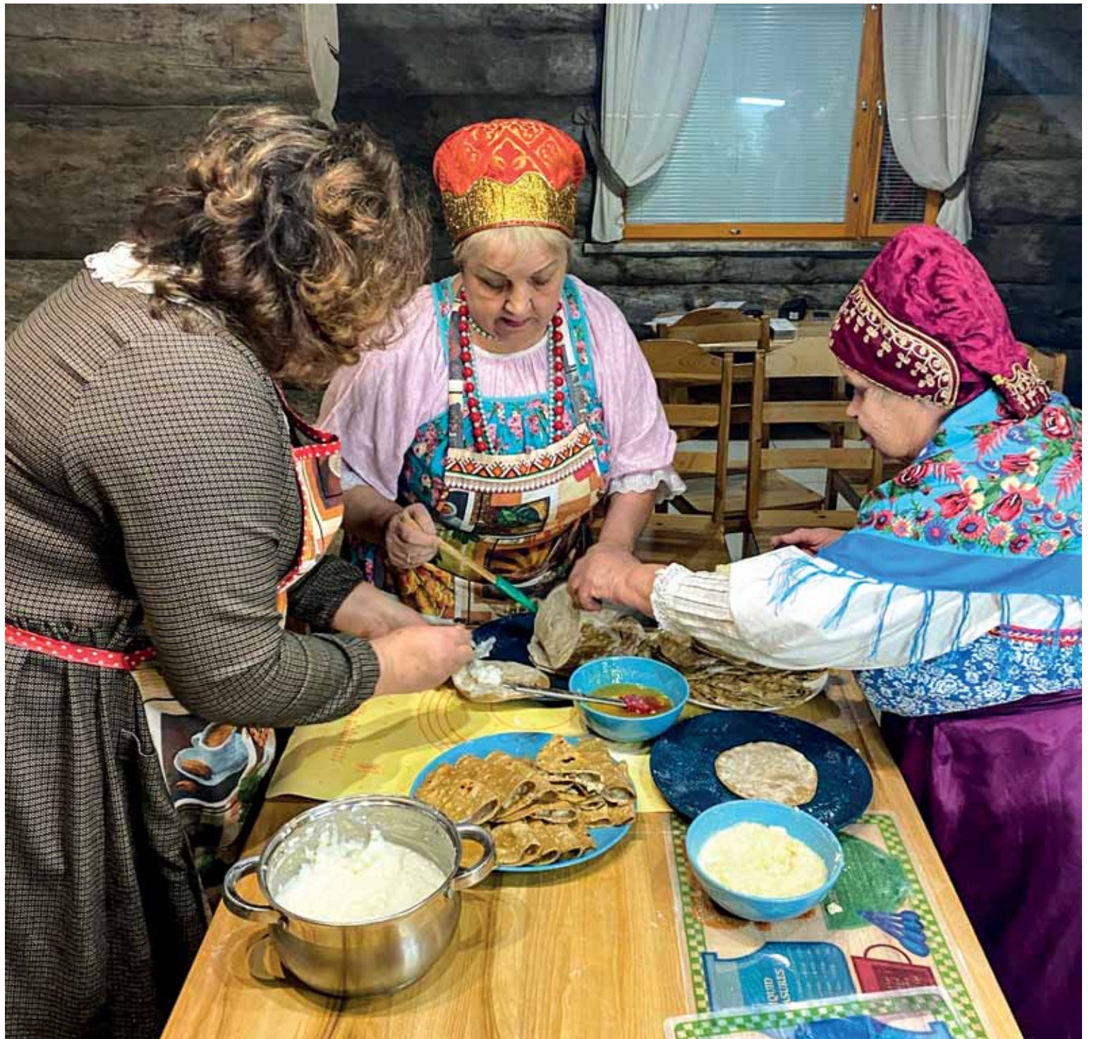
Piirakka-työpajoissa turistit oppivat laittamaan perinneruokaa ja saavat tietoa karjalaisesta kulttuurista.

mistojen ja oppaiden kanssa. Nyt se ei suju hyvin, hän lisäsi.