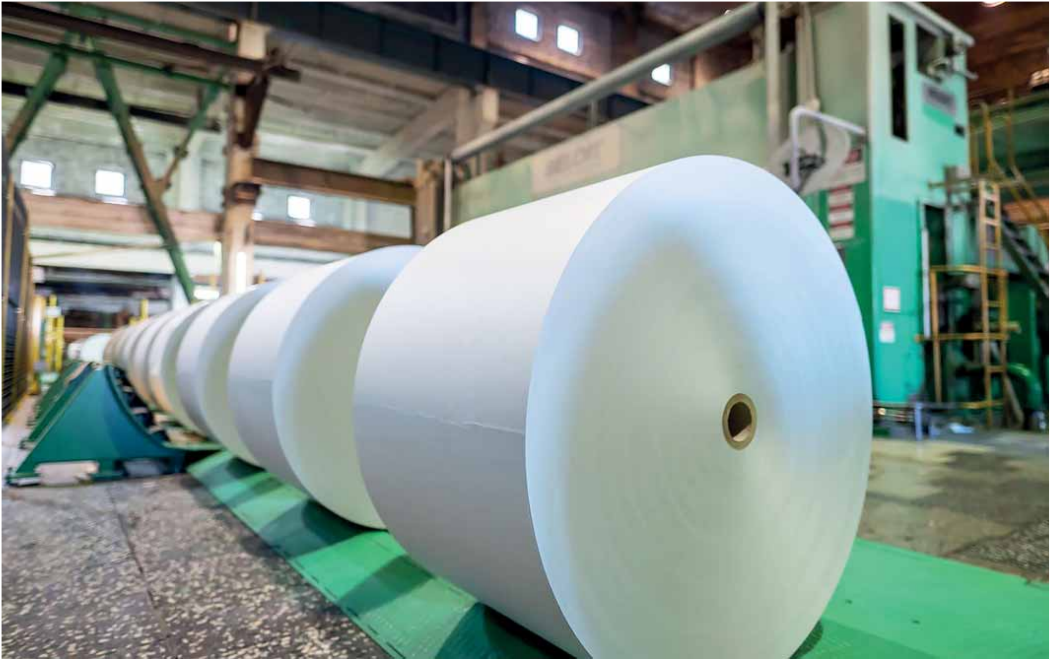
Vuodesta 2022 tehdas on toteuttanut investointihanketta. Sen tavoitteena on vuoteen 2027 mennessä lisätä paperintuotantoa 722 000 tonniin vuodessa sekä käynnistää viskoosisellun tuotanto.