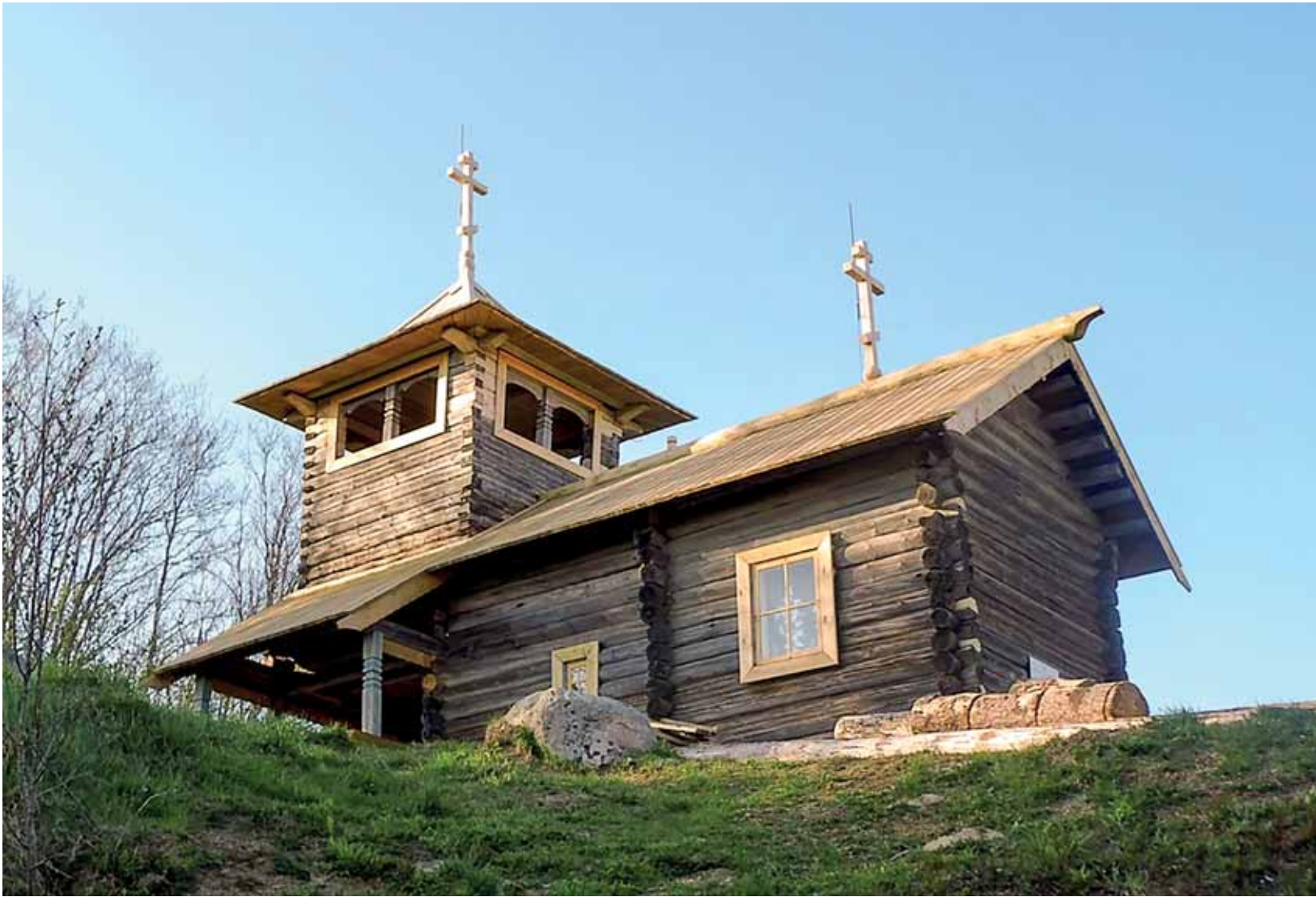
Hanke on syntynyt tarpeesta rakentaa metalliset portaat mäelle, jolla seisoo Pyhän Yrjön tsasouna.