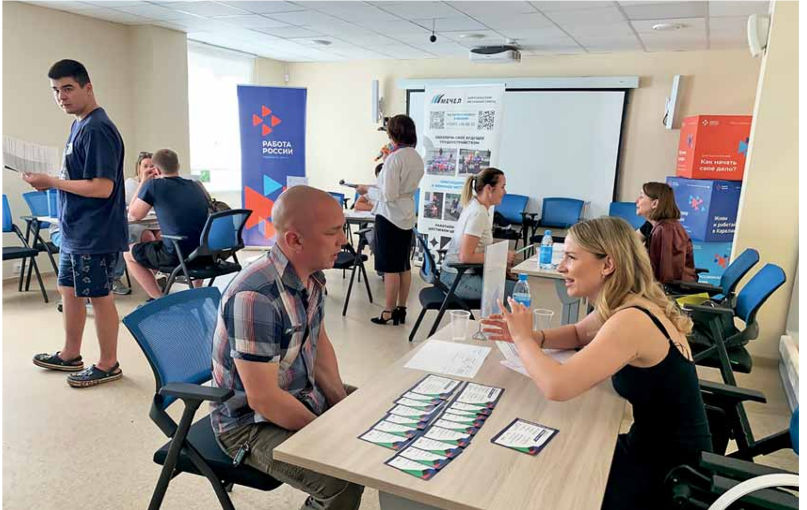
Rekrytointimessuilla työnhakijat tapasivat kymmenien työnantajien edustajia ja sopivat työhaastatteluista.

– Kutsumme työhön alle 50-vuotiaita miehiä ja naisia. Palk-