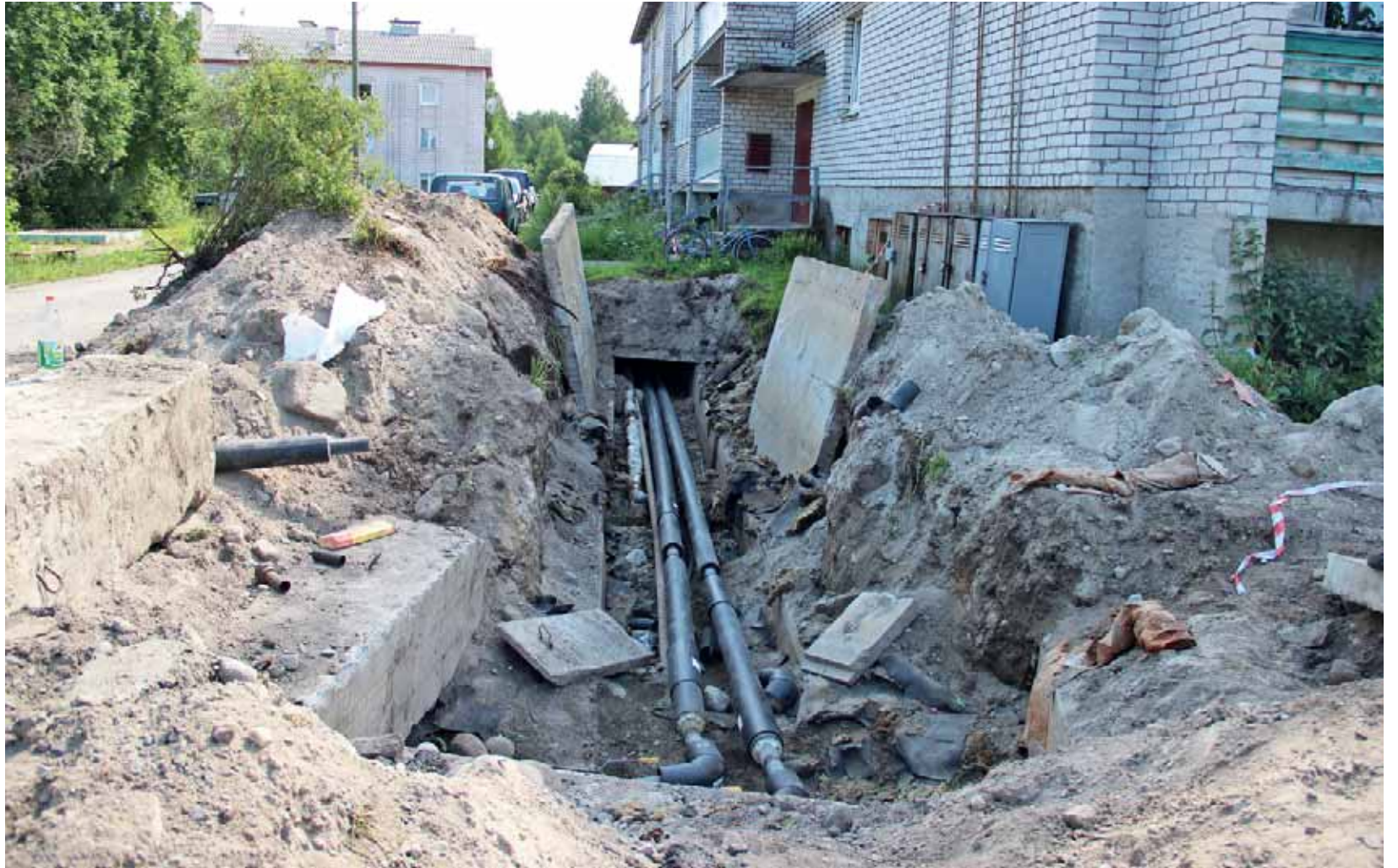
Viime vuonna mittavimpia töitä tehtiin Suojärvellä, jossa uusittiin noin yhdeksän kilometriä lämpöjohtoja. Sen tuloksena vakavia vaurioita ei tapahtunut lämmitysverkossa talviaikaan.

Lämmitysverkon vaurioiden määrä kasvoi viime lämmityska-