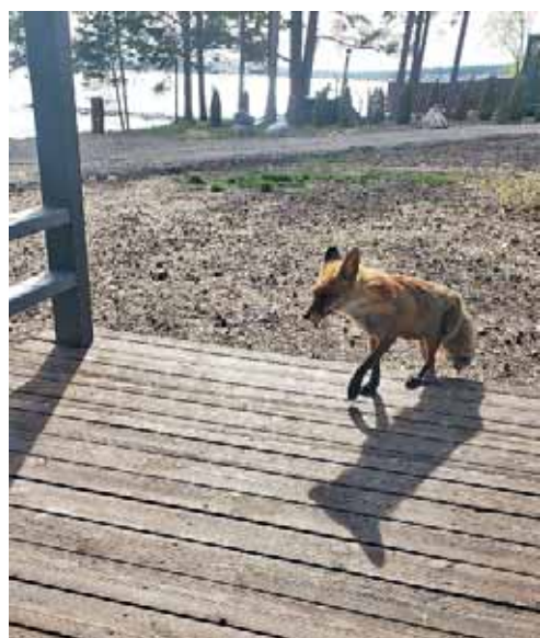
■ LUONTO Äänisen rannalla.