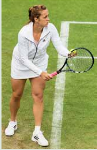
Venäläinen tennispelaaja Anastasiya Pavljutšenkova.