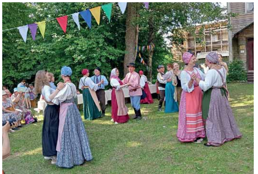
Petroskoin historiallinen kortteli Fedosovankadulla muuttui yhdeksi päiväksi 1900-luvun alun kaupungiksi.