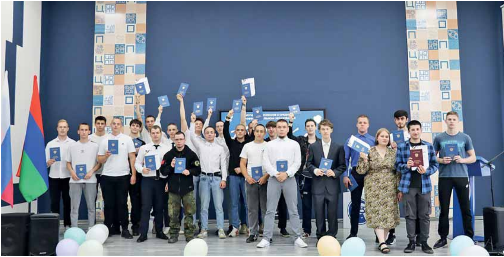
Tänä vuonna Petroskoin autoliikenneopistosta valmistautui yli 500 nuorta, joista 105 opiskeli Professionalitet-hankkeen ohjelman mukaan.