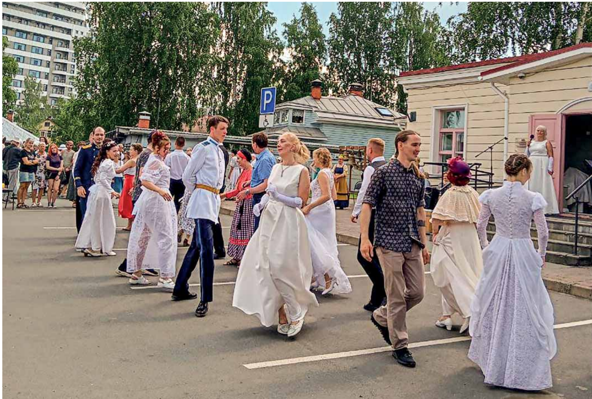
Vanhan kaupungin illuusiot -juhlasta on tullut kaupunginpäivien mukava perinne ja Petroskoin symboli. Tänä vuonna juhlan aiheena oli Perheen vuosi.