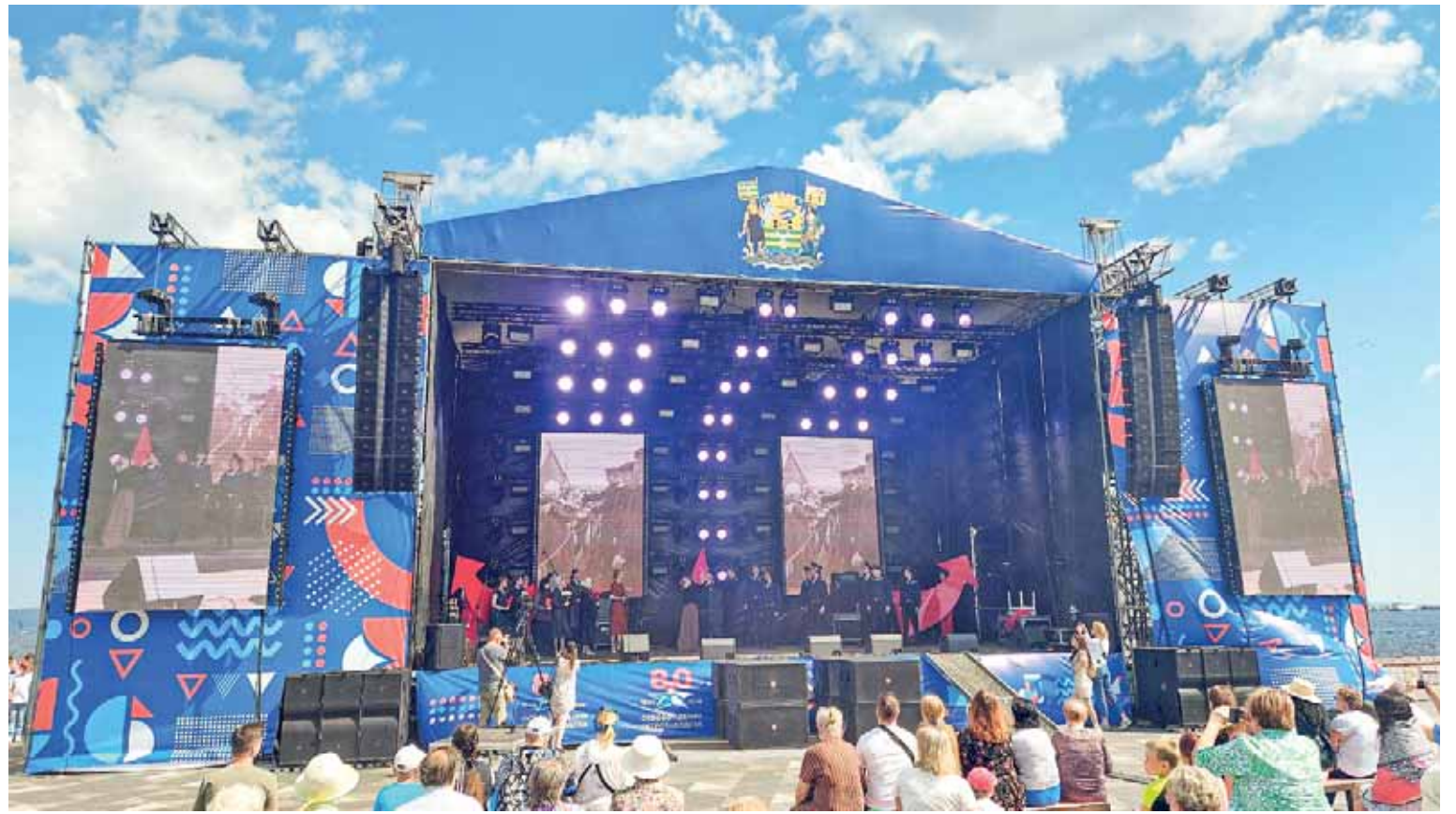
Tänä vuonna kaupunginpäivä oli omistettu Petroskoin vapauttamisen 80-vuotispäivälle. Historia-aiheinen esitys oli tarjolla juhlan päälavalla.

koi-päivänä 15. kertaa. Tänä vuonna juhlan aiheena oli Perheen vuosi.