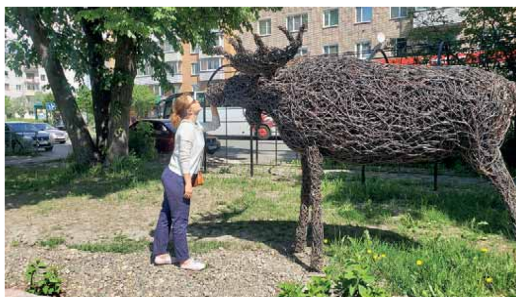
■ IHMINEN Sortavalan-matkalla.