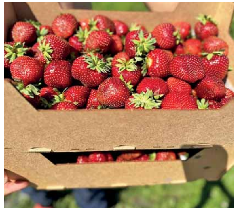
Tänä vuonna ensimmäiset marjat kypsyivät tavallista nopeammin. KUVA: KSENIJA SADUKOVAN ARKISTO

Mansikanviljelijä Ksenija Sadukova kasvattaa marjaa seitsemällä hehtaarilla. KUVA: KSENIJA SADUKOVAN ARKISTO